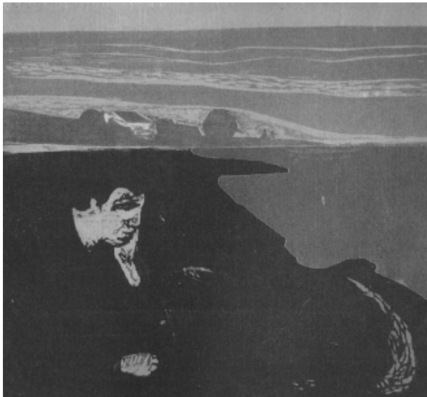
Abb.1: Edvard Munch: „Melancholie I“ (1896)

Bereits den Griechen war die Symptomatik bekannt und ist dort aufgrund von Beobachtungen beschrieben und behandelt worden. Die Beobachtung war bei ihnen eine wesentliche Forschungsmethode, und das ist ein Grund, weshalb so vieles, das in der Antike beschrieben worden ist, über Jahrhunderte seine Gültigkeit haben wird. Sie prägten den Begriff der Melancholie, ‚melan‘ heißt schwarz und ‚cholos‘ Galle, also der Schwarzgalligkeit.