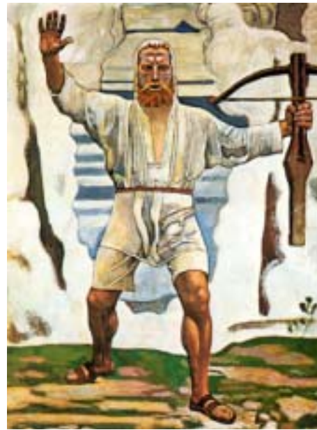
Abb.2: Ferdinand Hodler: „Wilhelm Tell“

Doch entstehen bei Hodler durch seine starken inneren Energien der Bewältigung, die etwas von der Kraft des Urgesteins haben und sich bildhaft als „Lichtenergien“ zeigen, Gestaltungen wie beispielsweise der „Tell“: Frische Schöpfung entspringt aus der Gewalt der Auseinandersetzung, stärkste Ich-Intension in der Kraft