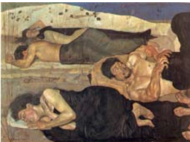
Abb.1: Ferdinand Hodler: „Die Nacht“

Der Maler Ferdinand Hodler hat schon in der Kindheit eindruckliche Begegnungen mit dem Tod. Er bringt als 14-jähriger seine auf dem Feld gestorbene Mutter mit dem Schubkarren nach Hause. In einem gewaltigen Bildfries „Die Nacht“ schafft er im Zentrum eine mächtige Dunkelballung, wie einen Berg, die ihn im Schlaf bedroht und erschreckt. Der „dunkle Genius“ wie er ihn selbst nennt, der Tod, begleitet ihn durch das ganze Leben.