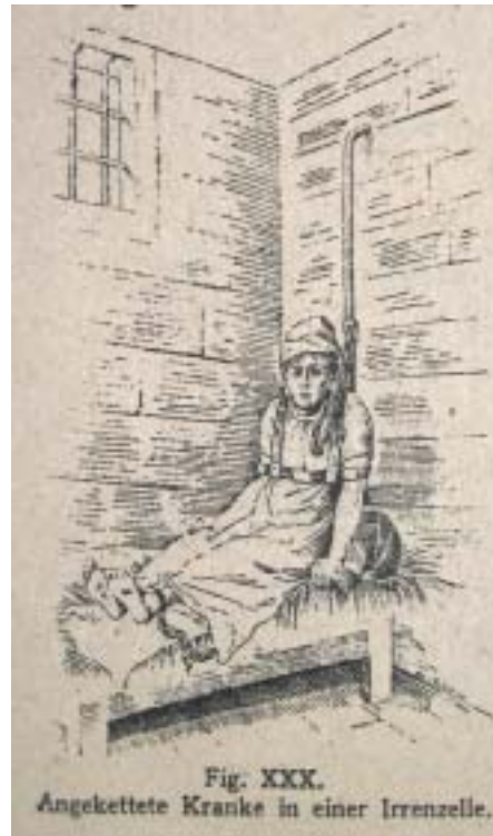
Abb.3: Darstellung einer psychiatrischen Maßnahme