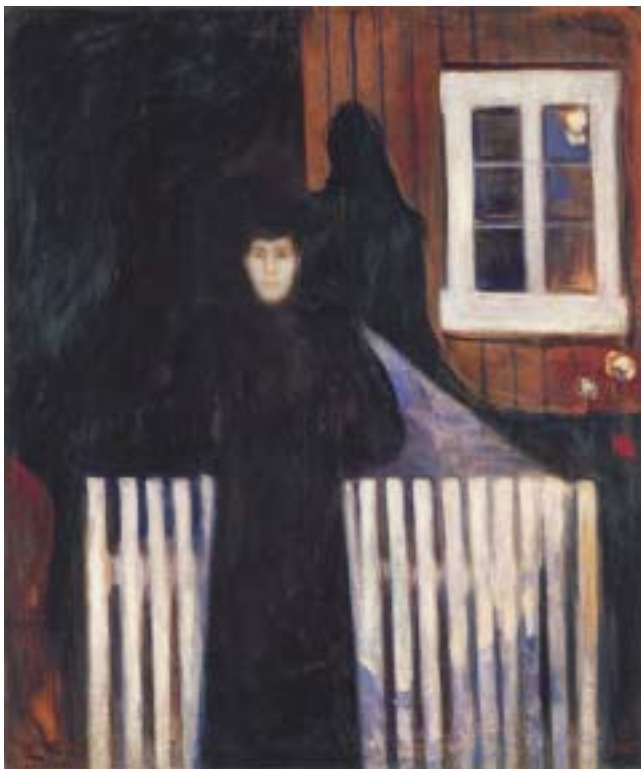
Abb.5: Eduard Munch: „Mondschein“

„Der Kuss“ heißt für ihn eintauchen in einen Dunkelraum, in dem er sich selbst verliert. Dort wird es zu einer Begegnung mit dem Tier „Vampir“, dort ist es auch das Erwachen für die Begegnung mit den Dunkelzonen der Schicksalsignatur.