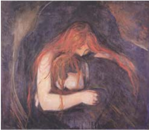
Abb.4: Eduard Munch: „Vampir“

Munch erlebt die Schatten nicht als Gegenstandsschatten, sondern als Bedrohungen. Dunkel wird dämonisch-wesenhaft. Solche Schatten steigen auf in der Begegnung mit andern