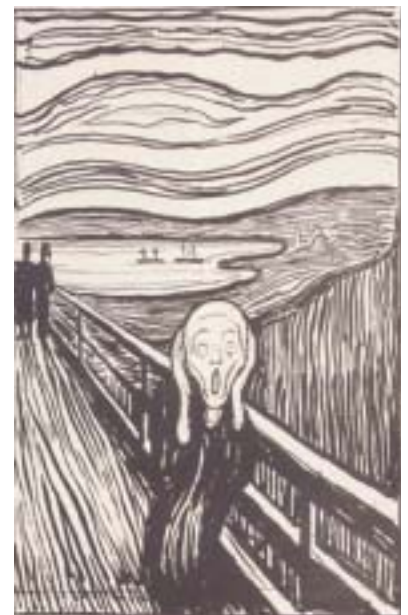
Abb.3: Eduard Munch: „Der Schrei“

Sein berühmtes Bild, „Der Schrei“ ist künstlerisch ein Durchbruch, ein Ereignis in der Biografie seiner Bilder. Er realisiert in freien Linien und Linienbewegungen, die