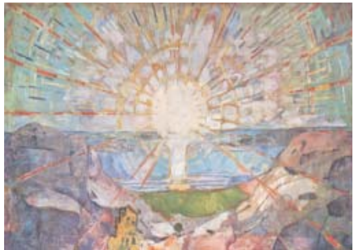
Abb.7: Eduard Munch: „Sonne“

Im Werk von Munch wird als Zeitforderung die Verwandlung des Dunkels greifbar. In einem gewaltigen Akt der Befreiung, der Überwindung, entstehen bei Munch die so genannten „Sonnenbilder“: Sonnenkraft in lichtester Helligkeit, „Weisheit“ als kraftvolles Bildzentrum zeigen eine Öffnung in einen fernen Raum, in welchem Quelle und Ausstrahlung eins sind.