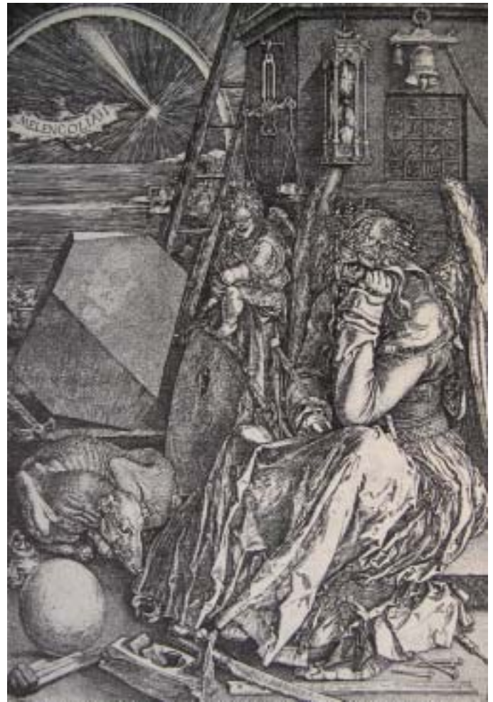
Abb.2: Kupferstich Melencolia I von Albrecht Dürer (1471-1528)

1621 erscheint das Buch ‚die Anatomie der Melancholie‘ von Robert Burton, einem Gelehrten in Oxford. Es ist ein Kompendium, wo das gesamte Wissen der damaligen Zeit akribisch zusammengetragen worden ist, angereichert mit eigenen Erfahrungen und Introspektion. Das Werk ist heute noch, allerdings in einer gekürzten Fassung, im Buchhandel erhältlich. Burton betont, dass kein Mensch – und mag er noch so weise, glücklich oder geduldig sein – von melancholischen Stimmungen verschont ist. Aber „je nachdem, wie